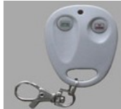
◀ Uzaktan Kumanda Modülü