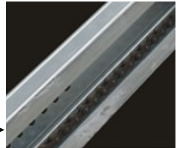
Motor rayı (Zincirli) ▶